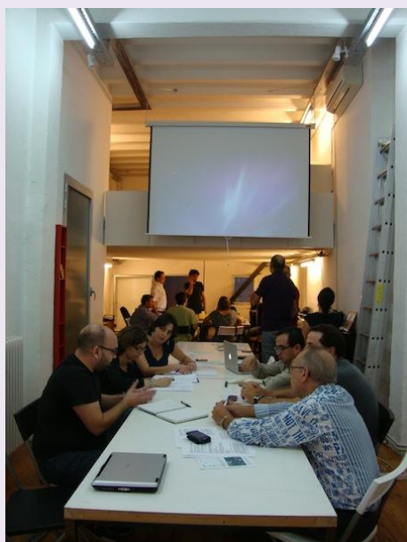
A snapshot of the Barcelona Meeting of the International Conference and part of the meeting's advertisement. Un momento del Encuentro de Barcelona de la Conferencia Internacional y parte del anuncio para el Encuentro.